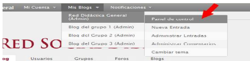
Imagen n.3. Cómo crear un blog en la Red Social Didáctica General

Cada estudiante ha participado, por defecto, del blog principal como suscriptor y del blog asociado a su grupo. Para administrar esta participación hay que entrar en el “Panel de Control” del blog en cuestión. Para ello debemos ir a la barra de menú superior y pinchar en el ítem “Mis Blogs – “Nombre del blog” – Panel de Control” (como se ve en la imagen 3).