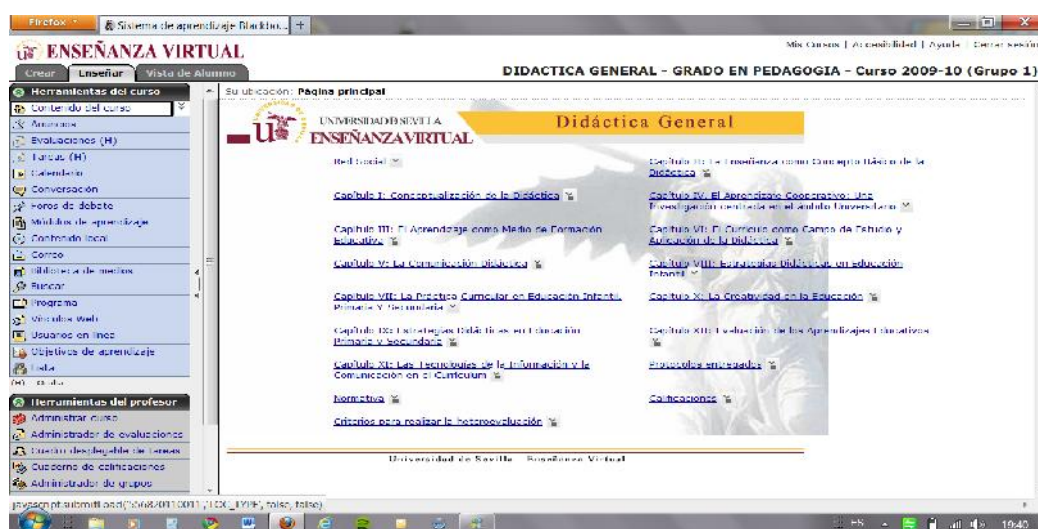
Imagen n.1. Plataforma WebCt de la asignatura Didáctica General.

En este sentido, hemos combinado aplicaciones complementarias como el modelo de contenidos basado en objetos de aprendizaje (WebCt, RODAS y OpenCourseWare) y uso de las herramientas surgidas de los servicios 2.0.