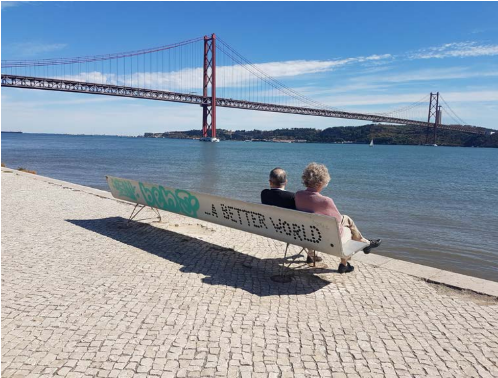
Lisbon, 2017. Sigrid Buerstmayr